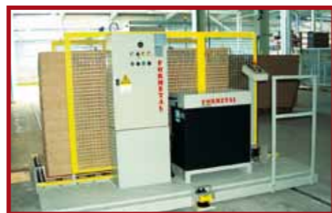
Navetta automatica a doppia pista per posizionamento pile in magazzino linee di carico. Double track automatic shuttle for the positioning of stacks in the loading line warehouse. Navette automatique à double piste pour positionnement piles dans entrepôt lignes de chargement. Navecilla automática con doble pista para posicionamiento pilas en almacén líneas de carga.