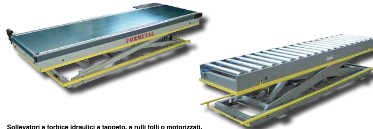
Sollevatori a forbice idraulici a tappeto, a rulli folli o motorizzati. Hydraulic forklift trucks, with belt, idle rollers or motorized rollers. Chariots élévateurs hydraulique à tapis, à rouleaux fous ou motorisés. Elevadores de horquillas hidráulicos con cinta o rodillos sueltos y motorizados.

Desde los elevadores de horquillas a los elevadores de nivel múltiple para almacenes automáticos... Los decenios de experiencia de Formetal nos permiten resolver problemáticas de desplazamiento y estivado de tableros, box y pilas para resolver todas las exigencias de la pequeña, media y gran empresa.